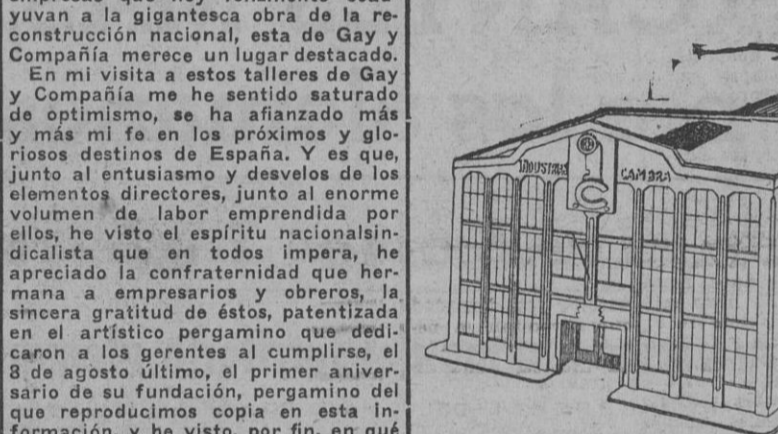
Una vista de los talleres de "Industrias Cambra".

Una Empresa ejemplar en todos los aspectos