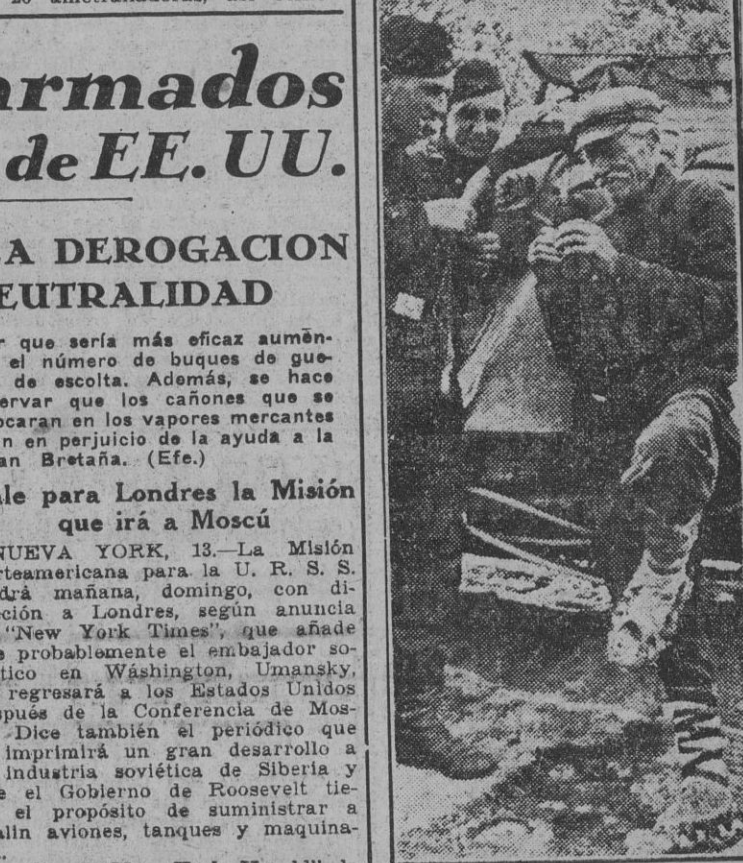
Este campesino, que conoció la Rusia de los Zares, conversa amablemente con los soldados alemanes, mientras que un aficionado a la caza de animales salvajes, en la que se aprecia la originalidad de la caza, muestra a los "zapatos" que usa para todos los efectos.