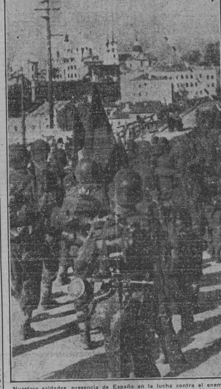
Nuestros soldados, presencia de España en la lucha contra el enemigo bolchevita, avanzan hacia los puntos indicados por el Mando.