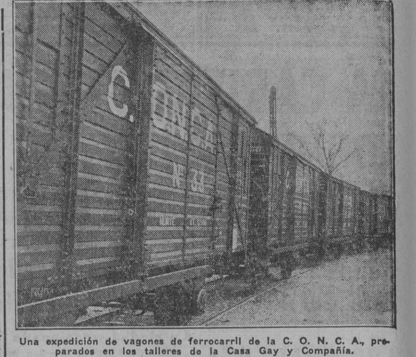
Una expedición de vagones de ferrocarril de la C. O. N. C. A., preparados en los talleres de la Casa Gay y Compañía.

OFICINA CENTRAL: Alcalá, 47, planta D - MADRID