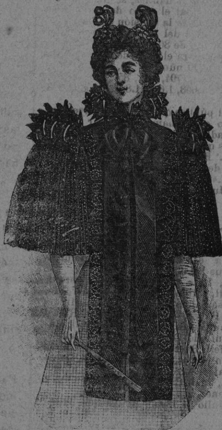
NOVEDADES PARA SEÑORA Recibidas de Paris

Recibidos los géneros de la Estación se expenderán con NOTABLE BARATURA