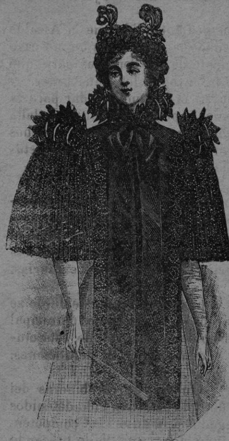
NOVEDADES PARA SEÑORA Recibidas de Paris

Recibidos los géneros de la Estación se expenderán con NOTABLE BARATURA