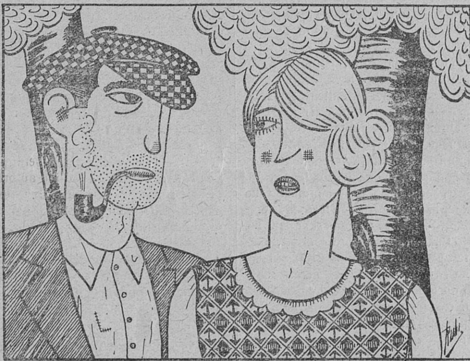
EL NOVIO ALBAÑIL

EL.—No podremos casarnos, María, porque no tengo trabajo.