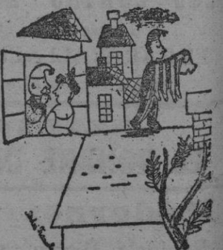
—Es el sonámbulo del 24; su mujer lo utiliza y se vale de su caminar nocturno para secar la ropa.