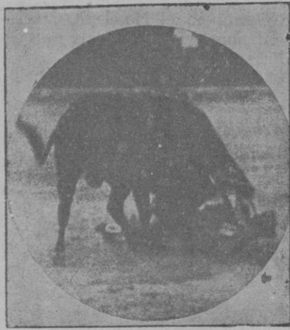
Momento de la cogida del joven diestro mallorquín en la Plaza de Valencia

dores se le tributaban con sus lámparas en los sitios oportunos, y el efecto se veía como por encanto. De estas combinaciones de claridades y penumbras su gen resultaba que al más ambicioso y duro de los escultores teatrales humillaba. Aquí sí que resulta cierto que la fantasía del hombre es humilde e incapaz frente a la fabulosa fantasía de la Naturaleza.