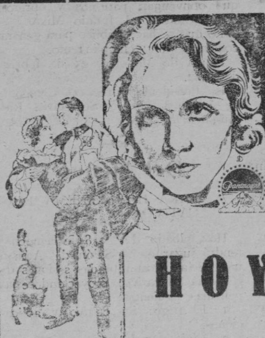
Marlene Dietrich Victor Mc Laglen

EN LOS PP. CARMELITAS.—Mañana domingo Fiesta mensual de la Semana Devota. Por la mañana, a las siete y media, Misa de Comunión general. Por la tarde, a las seis, rosario, trisagio cantado, sermón por el