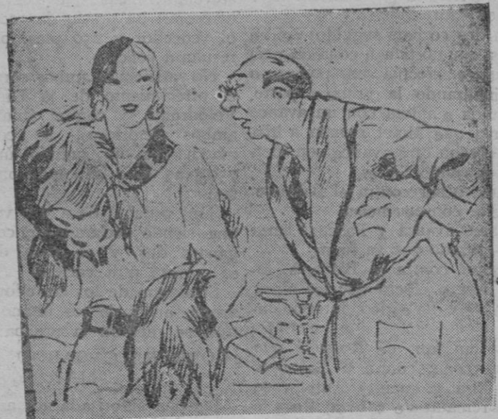
LA NUEVA MODA

Ella.—¿Cómo encuentras mi sombrero? El.—No lo encuentro; lo busco.