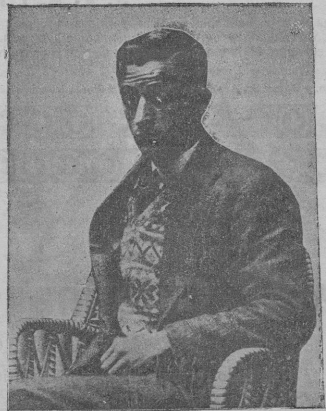
Figura de actualidad por su evasión de la Cárcel y su nuevo intento de librarse de la prisión

El señor Gobernador recibió por la mañana a una comisión de obreros huelguistas, celebrando más tarde otra reunión con los obreros que forman la Comisión de huelga.