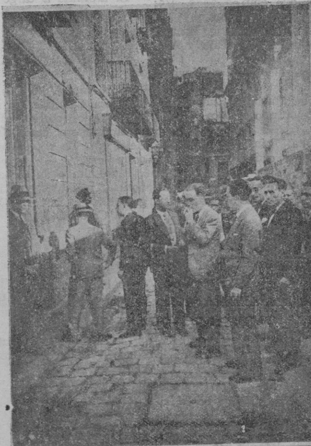
El Alcalde de Barcelona y el Jefe de Policía ante el local del Sindicato de Construcción de la calle de Mercaders, donde los sindicalistas se habían hecho fuertes, disparando contra la fuerza pública