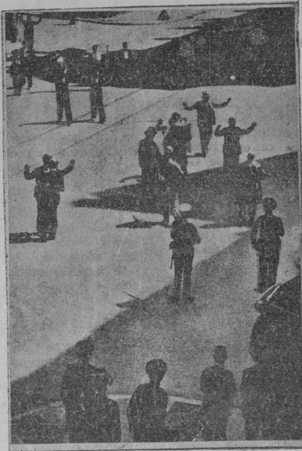
La policía cacheando a los transeuntes