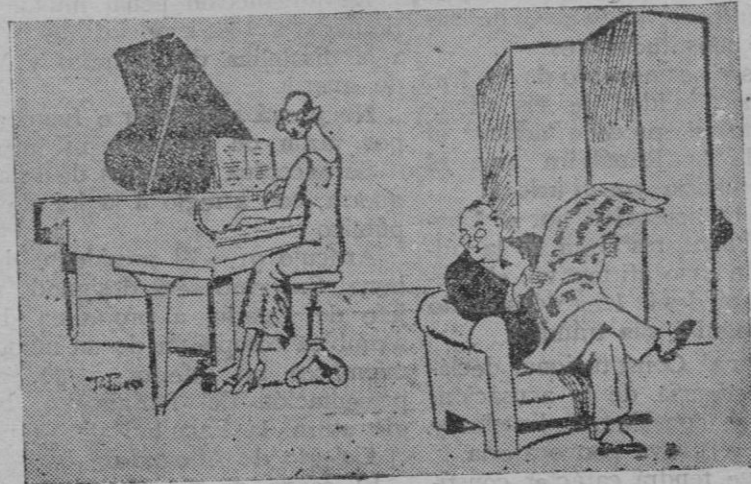
—Dí, papá: cuando me case, ¿me llevaré el piano? —Sí...; pero hasta que salgáis de la iglesia no se lo digas a tu novio.