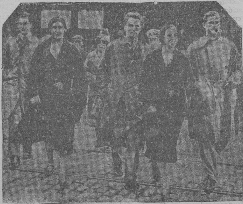
Se ha hablado recientemente de la próxima boda de la ex-Infanta doña Beatriz con D. Alvaro de Borbón Orleans. La fotografía representa a las ex-Infantas doña María Cristina y doña Beatriz, al ex-Infante D. Juan, a D. Alvaro y a su hermano D. Alfonso, paseando por Ulster en su reciente viaje por Irlanda

cial, el presente sirve de contestación.