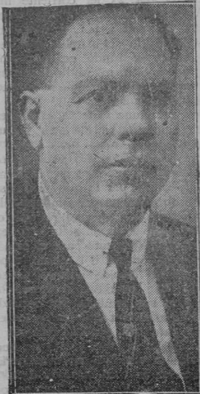
El notable actor de la companyia de Borrás, que ha fallecido en Madrid