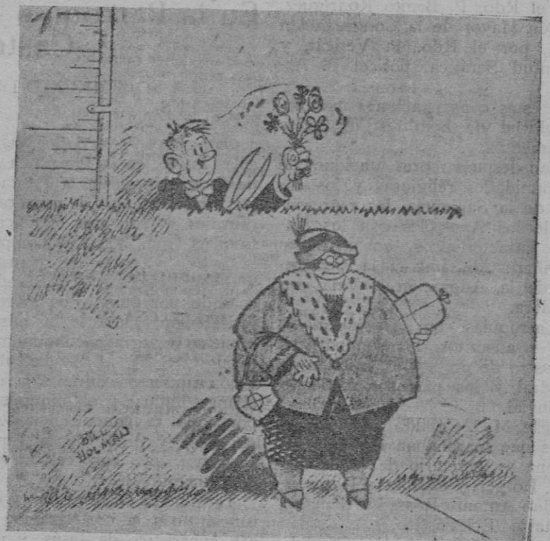
—Estas lluvias de primavera han hecho que se adelante el brote de las flores.