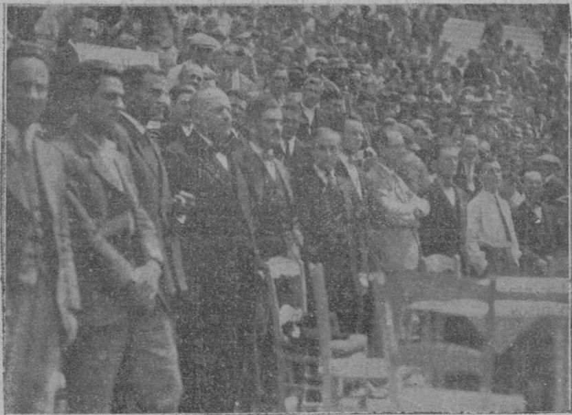
La presidencia del mitin