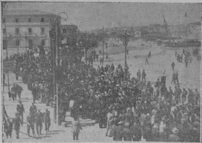
La manifestación al subírsele la población, después de formarse en el Paseo del Muelle