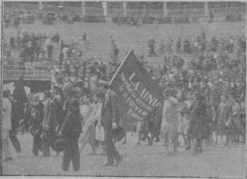
Parte de la manifestación al desfilar en el redondel de la Plaza de Toros