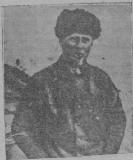
Acaba de fallecer en Noruega. —Su nombre fué célebre porque salvó al general Nóbte en el Polo Norte

to acababa de decir. Hubo insistencias, negativas, nuevas insistencias, nuevas negativas, intervención conciliadora del amigo común y por fin llegamos a una fórmula de arreglo: publicidad para las declaraciones y anónimo para quien las hizo. Tal es la razón de que este reportaje man-