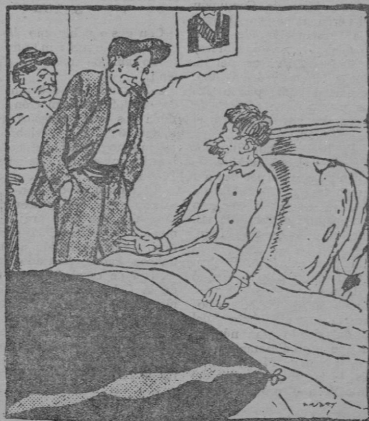
—¿Y dices que estás cansado habiendo dormido tus buenas diez horas? —Sí; pero me las he llevado soñando que trabajaba. (De «Le Rire», de París.)