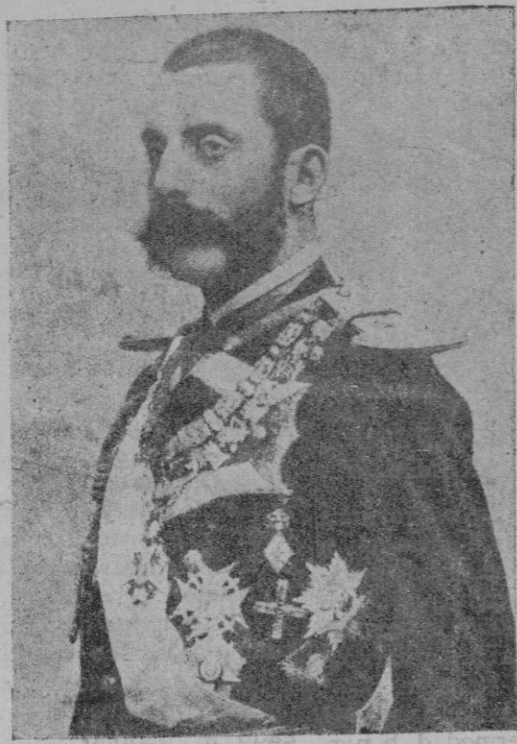
El infante don Antonio de Orleans, que ha fallecido en París.