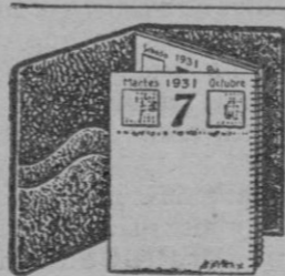
Tabla y Bloc 4,50 y Bloc 1,90 recambio

Muy práctico—Se hojea como un libro Se conserva todo el año encuadernado