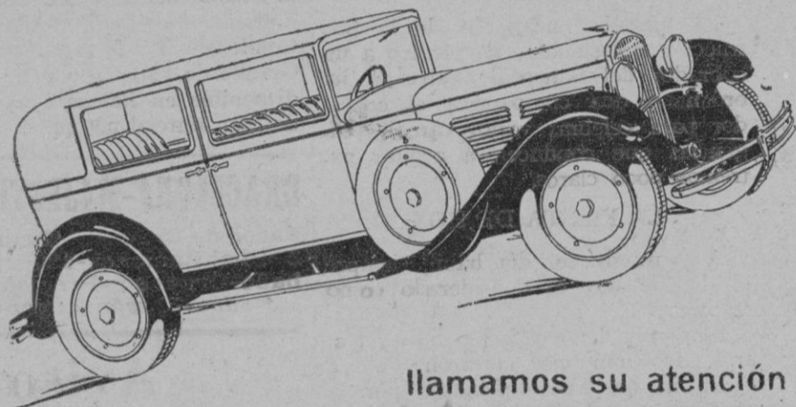
Uno de los tipos de serie del Nacional Pescara

Organizando su red de Agencias participa a los interesados que todavía quedan algunas disponibles, y por lo tanto