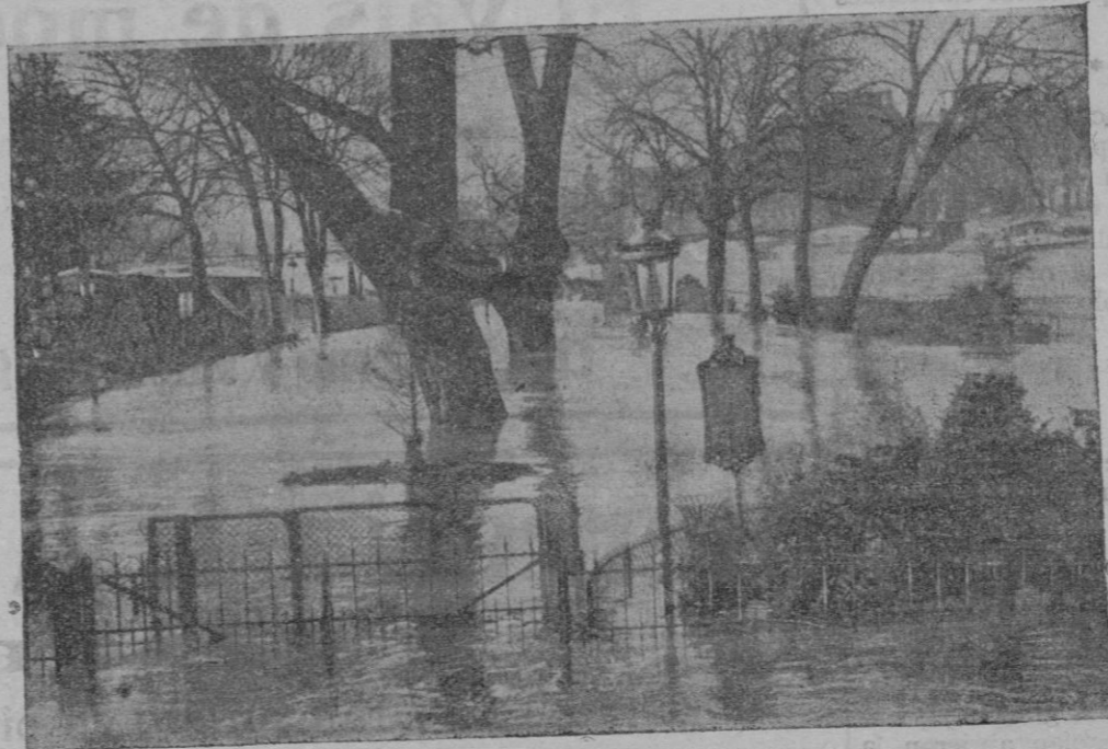
Aspecto de los muelles de Vert Ga'ant inundados por la crecida del Sena