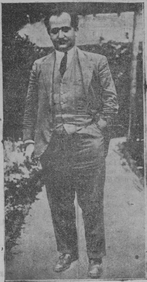
Una de las recientes fotografías del Comandante Franco