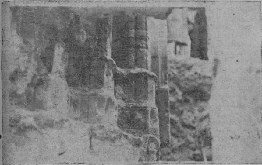
Basamento de las columnas puesto al descubierto en las obras que se efectúan en la calle de Sto. Domingo