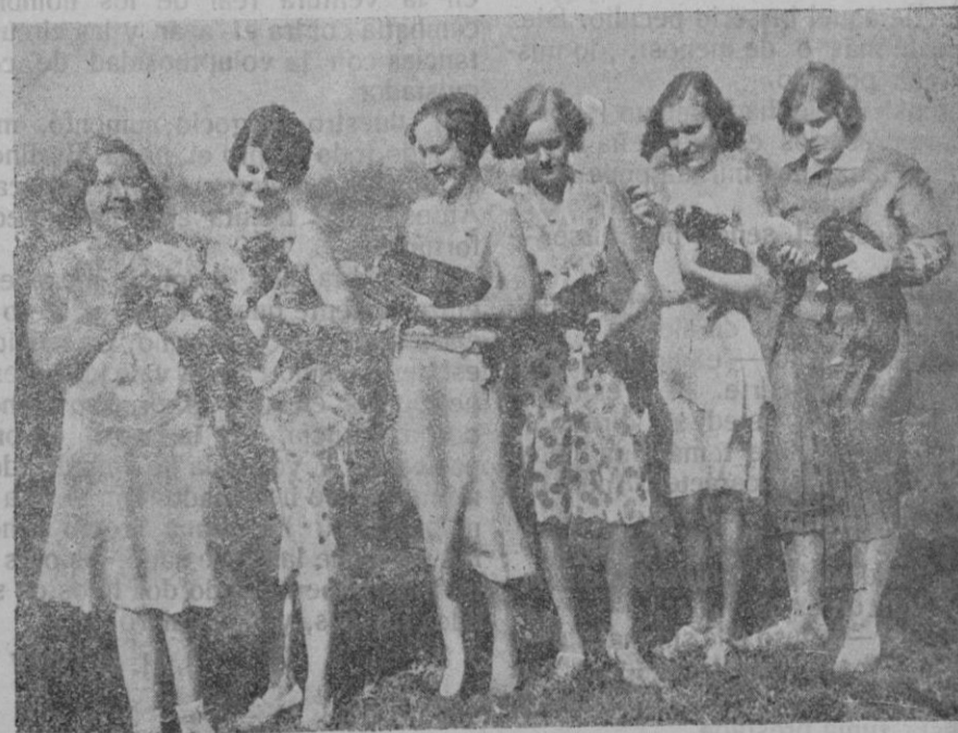
Señoritas californianas alimentando con biberón unos gorrinillos presentados en la exposición de ganados, celebrada en Pomona