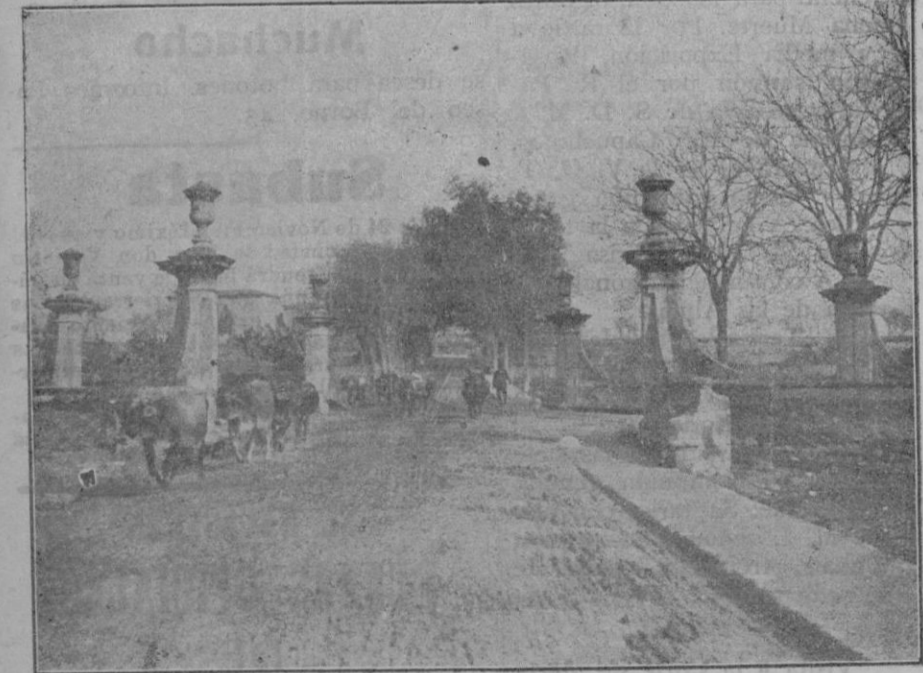
Desaparecut Paseig de ses Quatre Campanes, i eran sis

toyne—me quedaban cuarenta y dos francos y seis céntimos, un traje completo, un abrigo, mis zapatos y sombrero, además de la ropa interior que llevaba puesta. Me quedaba también una sortija de familia; valía tal vez 700 francos para un aficionado, pero todo lo más 20 luses para un joyero. Vagaba alrededor de los Mercados lleno de aflicción y de temor. Porque tenía la certidumbre de mi nulidad mercantil. Mi padre, hombre excelente y lleno de una deliciosa indiferencia no se había mezclado en mi educación sino para inspirarme gustos de lujo, me había hecho instruir tan mal, que ningún diploma ni siquiera el indiferente diploma de los bachilleres se contaba entre mis papeles. Además ninguna idea guarnecía mi cerebro. Aparte de un poco de esgrima, de tiro de bastón y baile, no sabía hacer nada con los miembros, y tenía un santo horror a sujeción. Perdido...—pensaba yo—. Soy débil y no podré vivir en la penuria. Tanto me da romperme la cabeza en seguida... Como hablada solo lo notó una mujer de figura rechoncha, que se había parado en el extremo de la acera. Tenía el rostro grueso, de fuerte barba, y sus ojos grises revelaban a