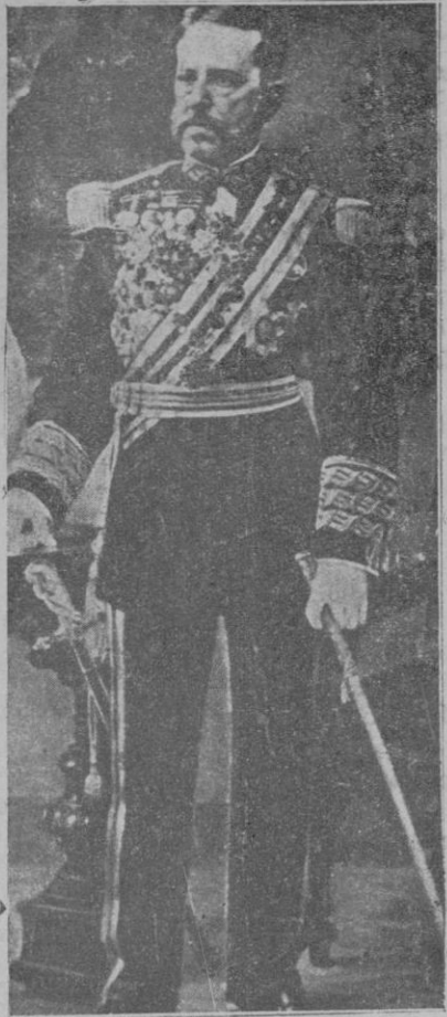
El general Weyler al ser ascendido a Capitán General.

Nuestro ilustre paisano el Excmo. Sr. don Valeriano Weyler y Nicolau, Capitán General de los ejércitos españoles, falleció ayer tarde en Madrid.