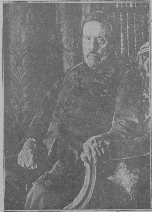
El general Weyler, al cumplir los 90 años de edad.

Fué nombrado Capitán General de Castilla la Nueva, cuando la boda de S. A. la Princesa de Asturias, ante el temor de que, los enemigos de este enlace, alterasen el orden.