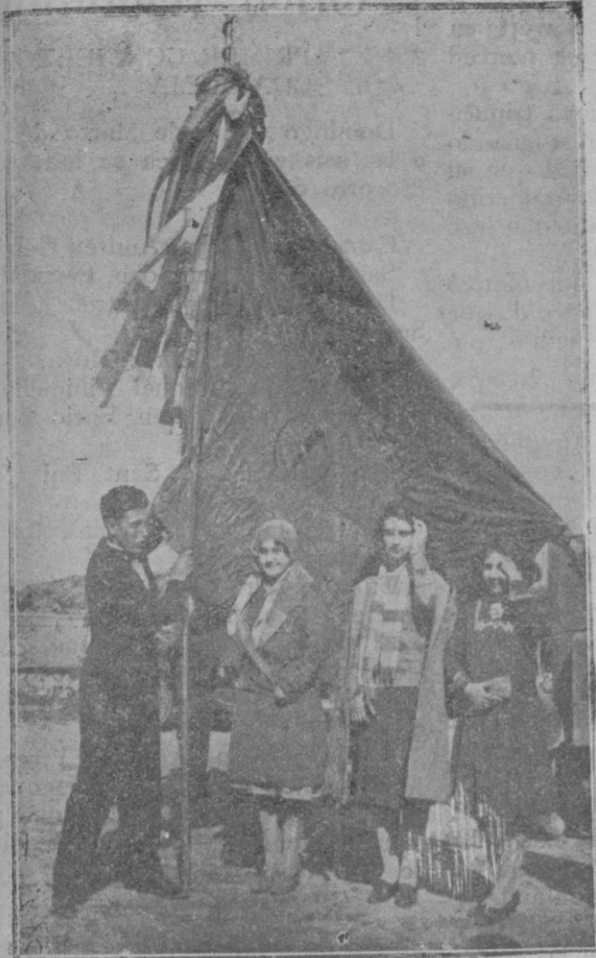
La bandera de la Tuna cobijando a la Madrina de Palma Srta. Delgado Roses y dos distinguidas señoritas