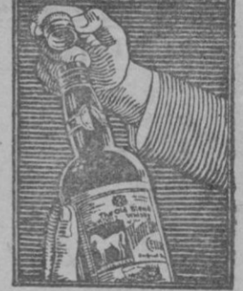
¡Se destapa tan fácilmente!

Es la marca más antigua de Escocia y se distingue por su madurez, suavidad y exquisito paladar; hasta la última gota está madurada en cascos de madera.