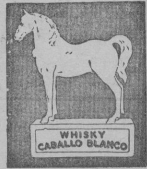
El Whisky «Caballo Blanco»

En el Asilo de San Juan de Dios se inauguró la ampliación de una sala para enfermos. Al acto asistieron las autoridades.