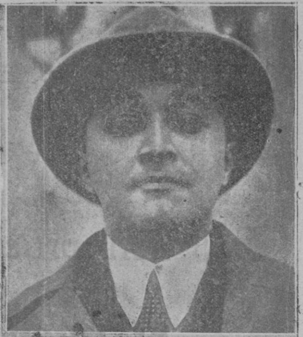
Ahmed Kadjar, ex-Sha de Persia que acaba de morir en el hospital de Neuilly, después de larga enfermedad

lo necesario con la sexta u octava parte que le correspondiese de cada artículo, lo que no sucedía con los de Málaga, por ejemplo, casi todos de aceite, ni con los de la costa cantábrica, todo harina, ni aun con los de Cataluña, en su mayor parte vino. Calculando que dichos frutos costasen unos con otros 80 duros por tonelada, las 30.000 toneladas, a que bien puede elevarse a causa de las ocultaciones, la capacidad de las indicadas 158 unidades de vela grandes de esta matrícula, tendríamos un capital de 2 a 2 y medio millones de duros, sin