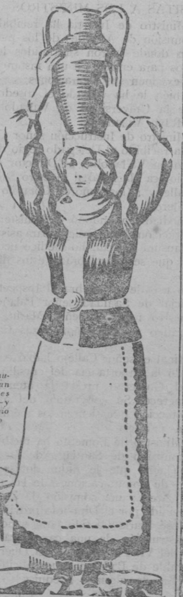
En Grecia — las mujeres desempleadas pesadas labores físicas. Buscan — y encuentran — alivio en el Linimento de Sloan

es el Linimento de Sloan. Gracias a su maravillosa propiedad de penetrar hasta donde se encuentra la base del dolor y deshacer la congestión que lo ocasiona, no solamente sirve para mitigar los dolores reumáticos sino que también es ideal para el cansancio muscular de los trabajadores o atletas, las torceduras, los bronquitos, frialdad de las extremidades y muchos otros casos en que ya ha demostrado su excelencia.