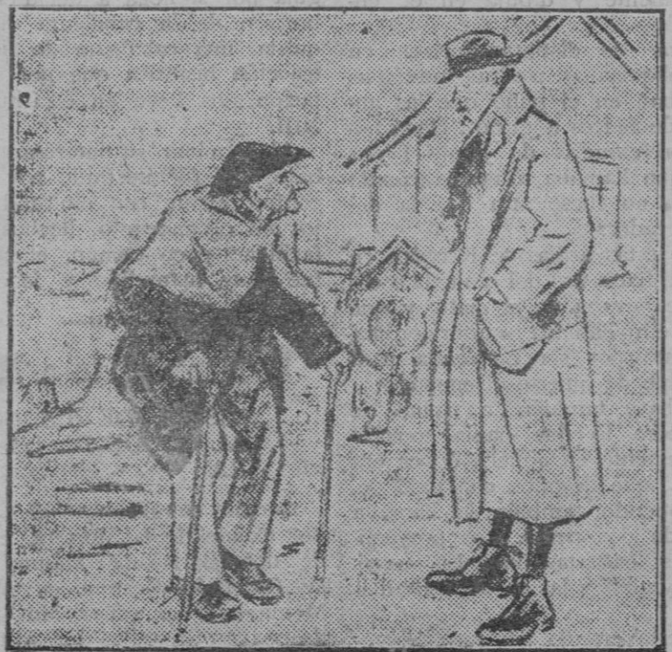
—El viajero.—¿Es bueno este pueblo para el reuma? El vecino.—¡Ya lo creo! Aquí he cogido yo el mío. (De «Judge», de Nueva York)