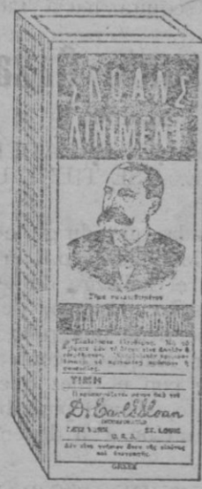
Paquete de venta en Grecia