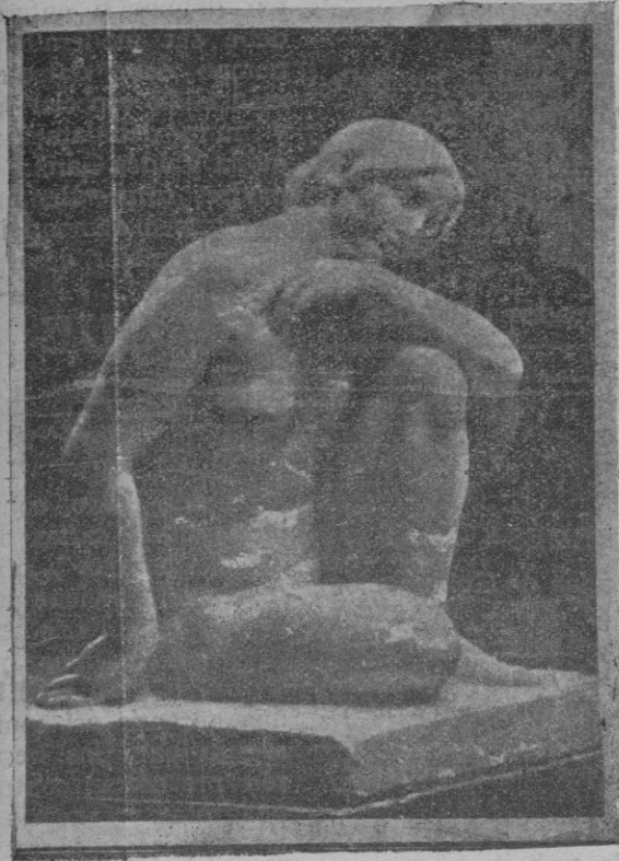
La escultura del artista Sr. Clará que ha merecido el premio de honor de la Exposición de Arte contemporáneo