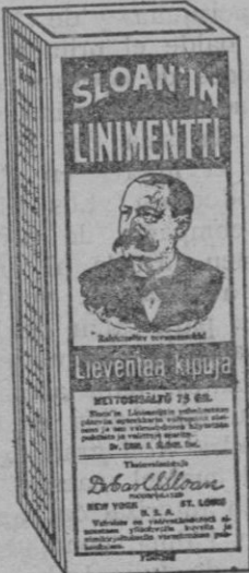
En Finlandia—los hechos de troncos, expuestos a golpes y accidentes, buscan—y encuentran—alivio en el Linimento de Sloan.

En los rigores invernales de Finlandia, el reumatismo, catarros al pecho, resfriados, se atacan con éxito mediante el Linimento de Sloan.