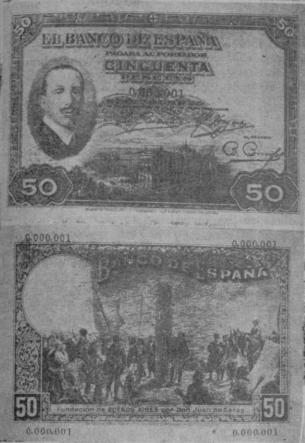
Anverso y reverso de los nuevos billetes de 50 pesetas

Informaciones de la Agencia Mencheta para LA ALMUDAINA