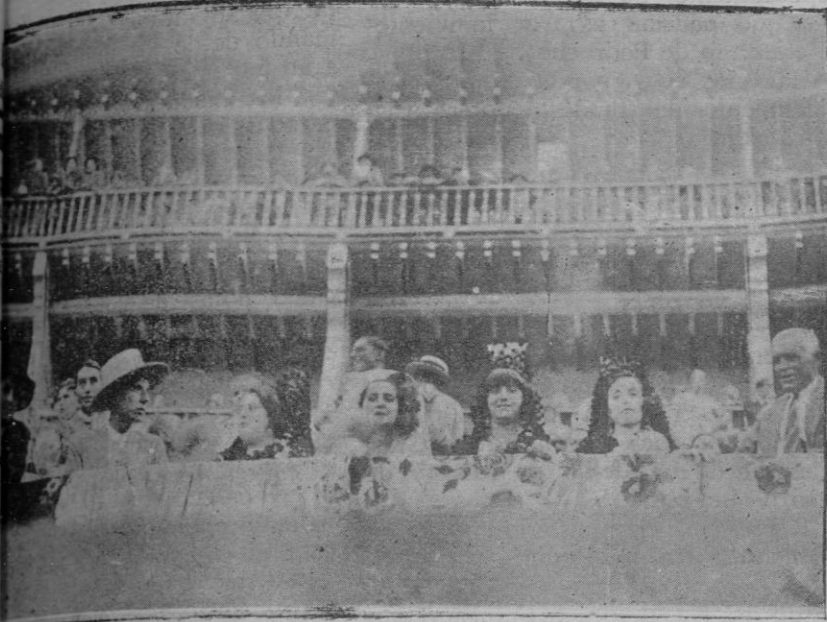
Las bellas señoritas que presidían la fiesta