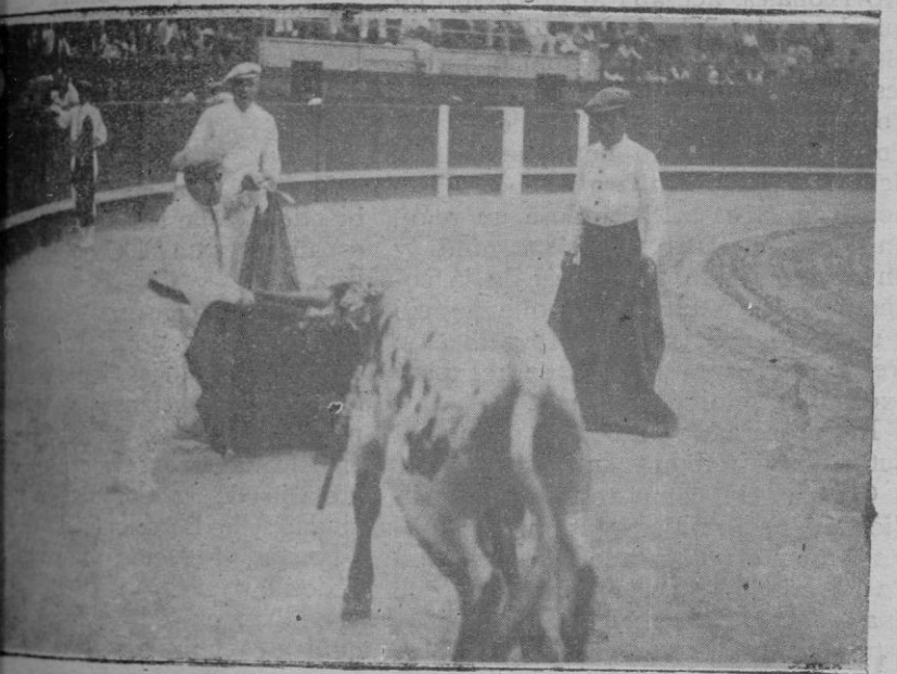
El espada que mató con la izquierda