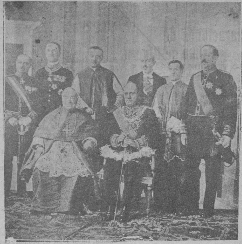
El Cardenal Gasparri y el Sr. Mussolini, con el alto personal, después de la ratificación del tratado de Letrán