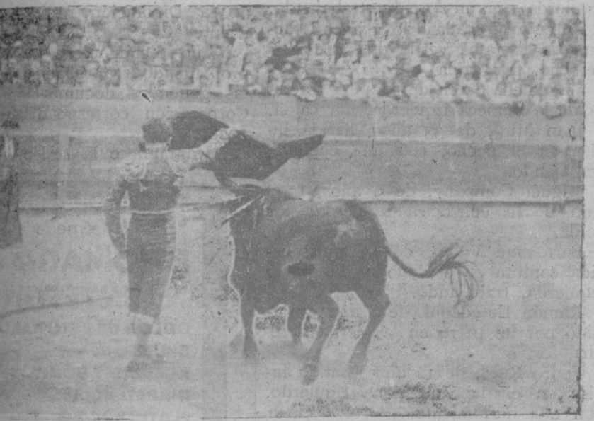
... de los pases de Pericacia, en su último toro, en el que le fué concedida la oreja