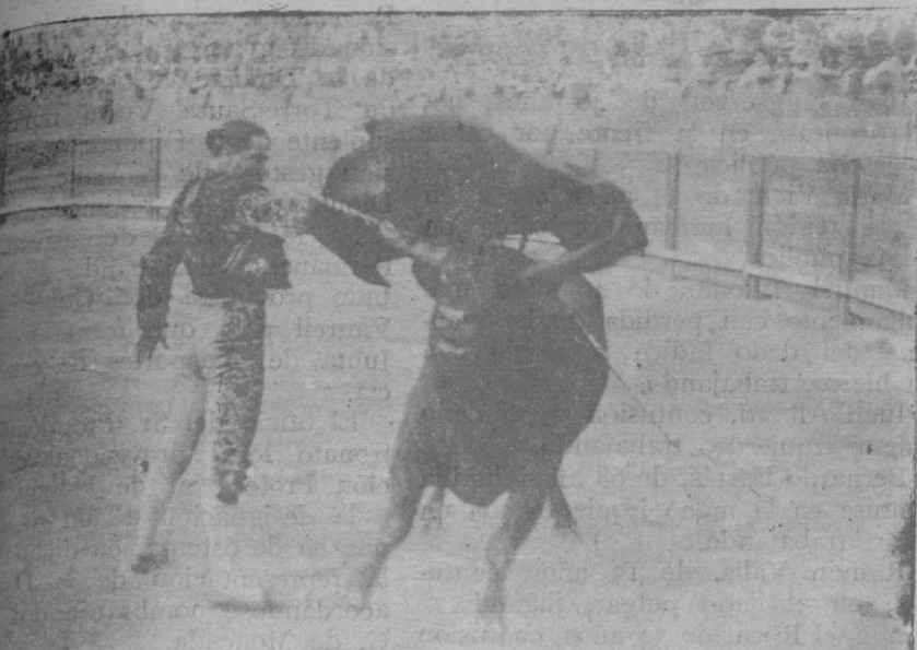
... dando un pase a su segundo toro. En este le fué concedida la oreja