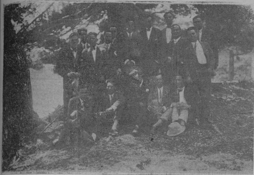
Los jóvenes que han obtenido el título de Maestro, reunidos en Formentor con el Director de la Escuela Normal