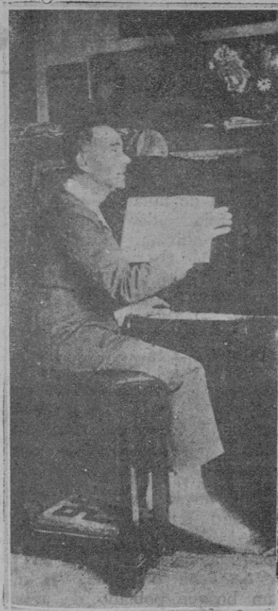
El tenor José Anselmi, que acaba de morir, artista predilecto, durante varias temporadas del Real, de Madrid

de los árboles simbólicos... ¿Qué lector podía seguirle, calzados los pies con el borceguí de hierro de las minuciosas combinaciones previas que exigía el procedimiento lógico? Pero junto al seco formulismo de sus diversos lucidarios, manaba ternura un corazón fervoroso, que fué dejando la estela de sus dolores y de sus esperanzas en libros inmortales.