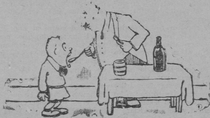
—Cuando los niños son buenos, y toman su hígado de bacalao, se les echa unas perras en la hucha...