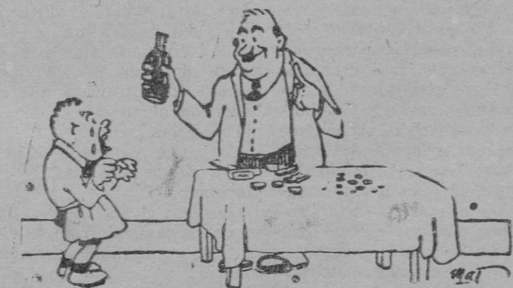
—...y cuando la hucha está llena se rompe, y con el dinero se compra otro frasco de aceite de hígado de bacalao.