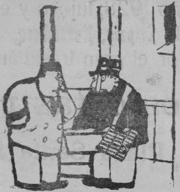
—¿Que le dé el aguinaldo? ¡Pero si ya vino usted el año pasado!