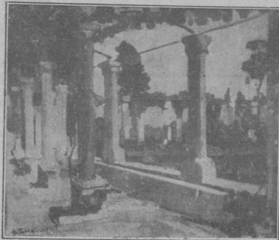
Tres de los hermosos cuadros de emparrados mallorquines, en la exposición en las Galerías Costa, tan elogiada por el público y la crítica