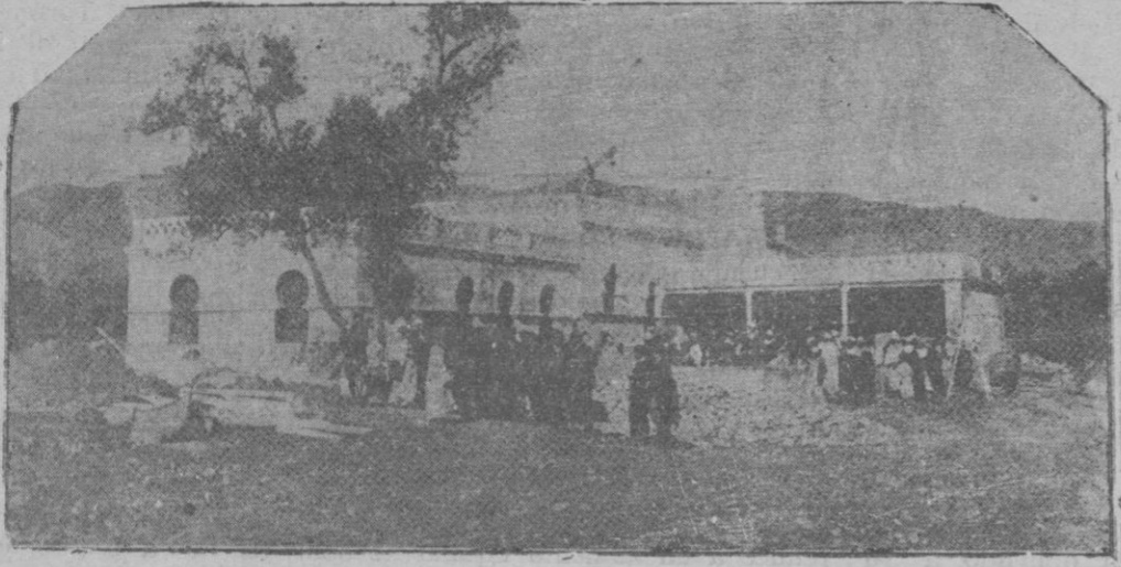
Nuevo molino acifero construido en pleno corazón de Beni Tuzin