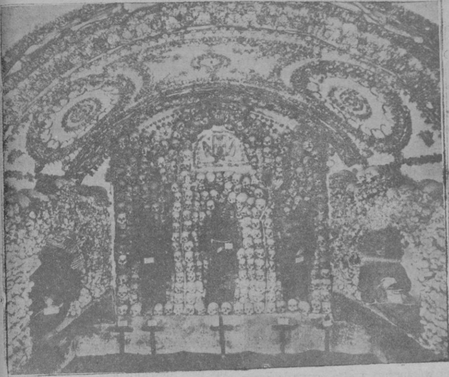
Capilla mortuoria cuyo adorno, está formado por cráneos y huesos de los P.P. Capuchinos