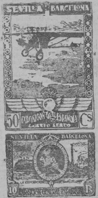
Los sellos que se pondrán en circulación con motivo de las Exposiciones de Sevilla y Barcelona

remos asombrados, desconcertados, pero rendidos ante la evidencia. Y como este caso no tiene explicación lógica posible (o la desconocemos) nos conformamos con decir que es un caso eminentemente excepcional.