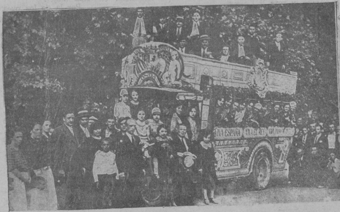
Camión adornado en el que desfilaban los representantes de Castellón