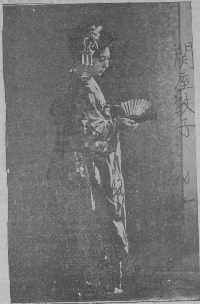
La tiple lijera Toshiko Sekiya que esta noche canta «R goletto»