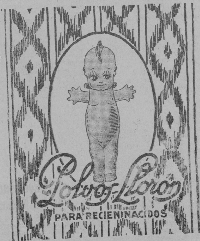
Pídalos en Farmacias, Droguerías y Perfumerías Comprando un bote puede ganar más de 100 pesetas

«OTTO LEGITIMO» Industriales y Marinos Instalaciones completas de riegos C. Aguilator, 22 PALMA