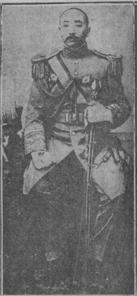
El mariscal Chang-Solin que al abandonar Pekín fué objeto de un atentado del que resultó gravemente herido

los pueblos rurales». Ved, pues, como nosotros hemos acertado el camino, yendo a predicar a los pueblos los preceptos de la Higiene.