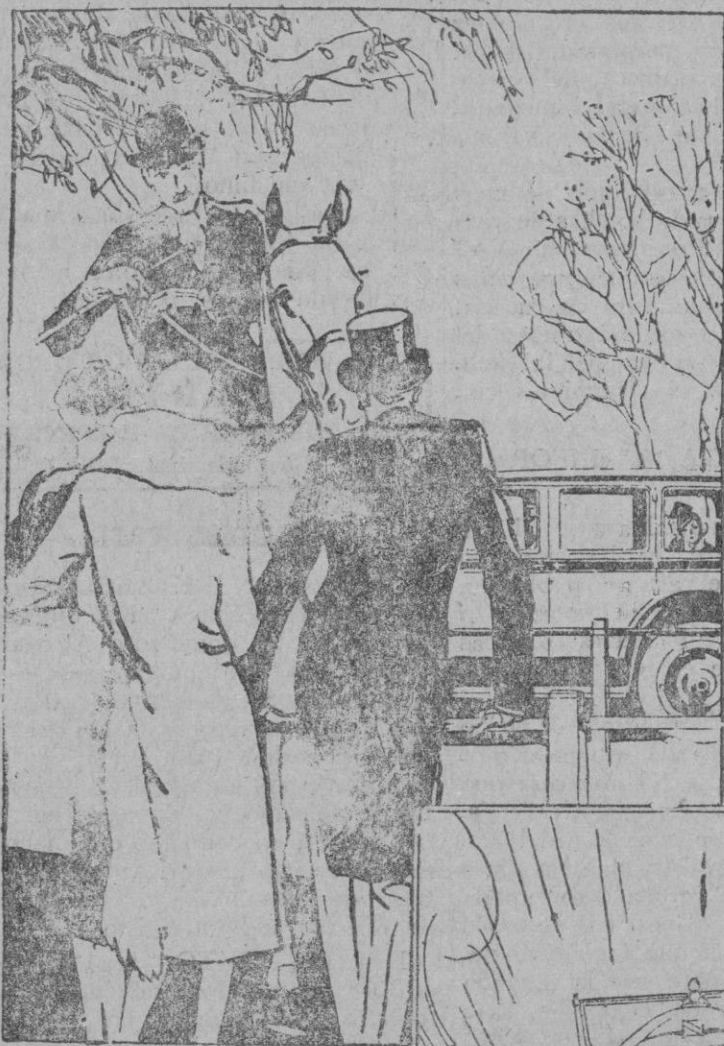
Allí donde se encuentre la gente distinguida se encuentra siempre el Buick