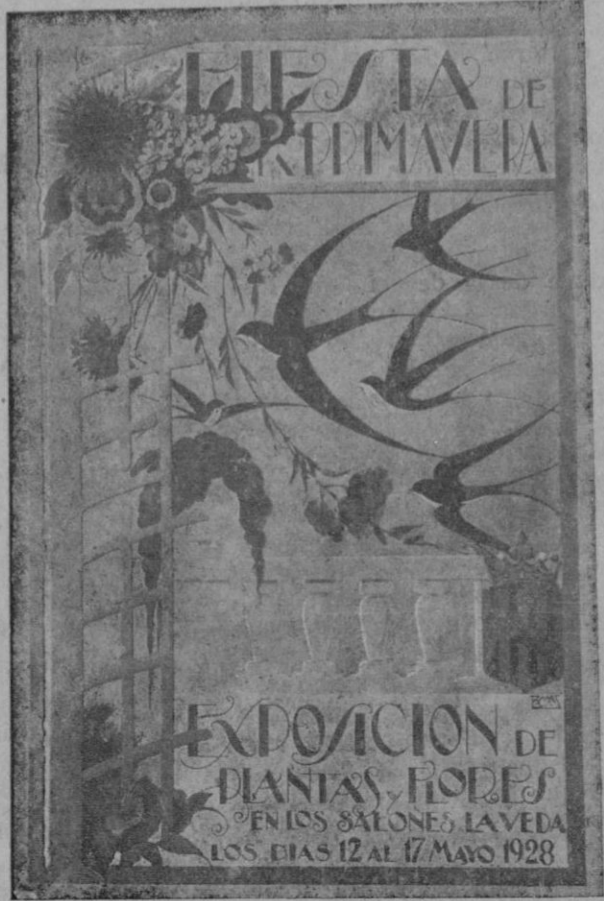
Hermosos carteles que para la Fiesta de la Primavera ha pintado el joven artista D. B. Mas