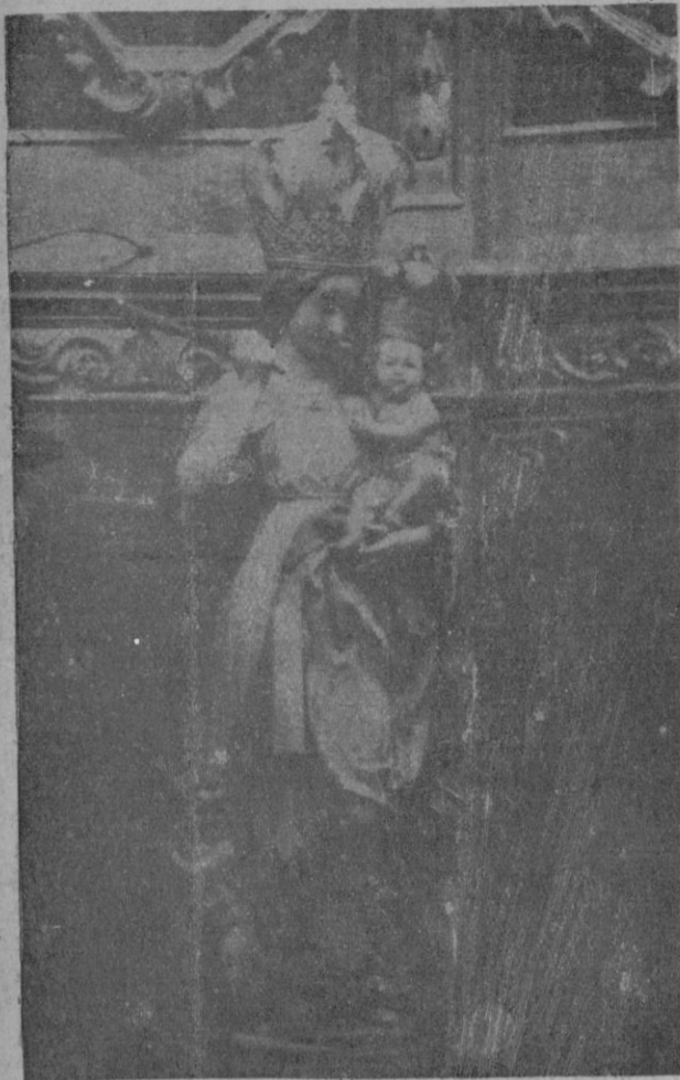
Bellísima Imagen de Ntra. Sra. del Socorro, de alabastro (siglo XVI). Se celebra hoy, 13 de Mayo, su fiesta.