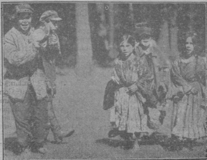
Los niños abandonados, que son legión en Rusia, vagando por los alrededores de Moscú