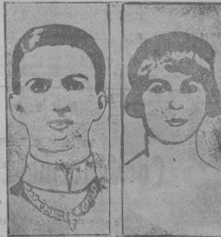
El Príncipe Humberto, heredero de la Corona de Italia y la princesa belga María, que contraerán en breve matrimonio