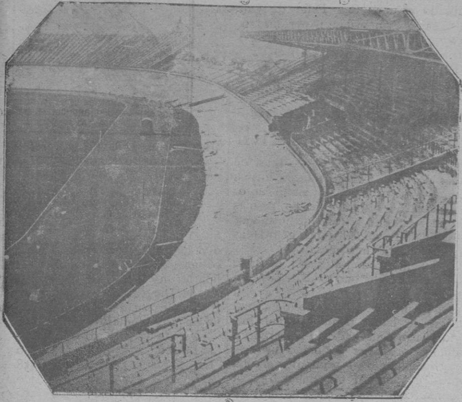
Vista del stadium donde han de celebrarse los Juegos Olímpicos Internacionales