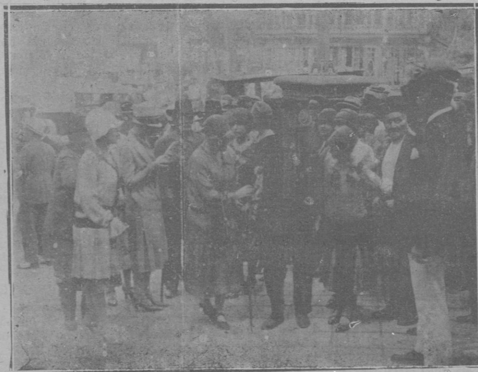
Grupo de señoritas sosteniendo a un viejo marino, de los premiados, que ha rebasado los 80 años de edad

manera caballerosa y heroica, mientras tal vez la denigraban los llamados a enaltecerla y dirigirla.