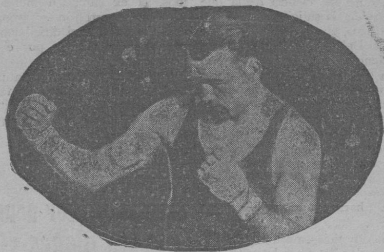
Jack Sharkey, clasificado como el tercero de los pesos pesados, que combatirá con Uzcudum el 28 de Noviembre pxmo.