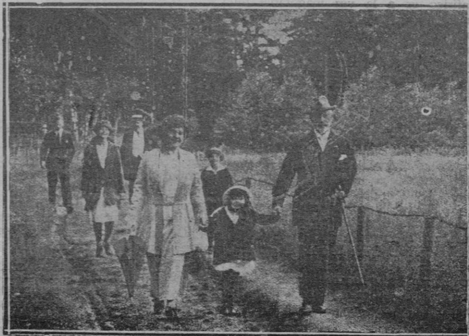
El ex-Kaiser paseando con su esposa e hijo menor, en la quinta donde transcurre su destierro