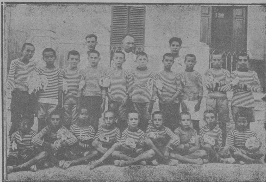
La colonia escolar de Génova