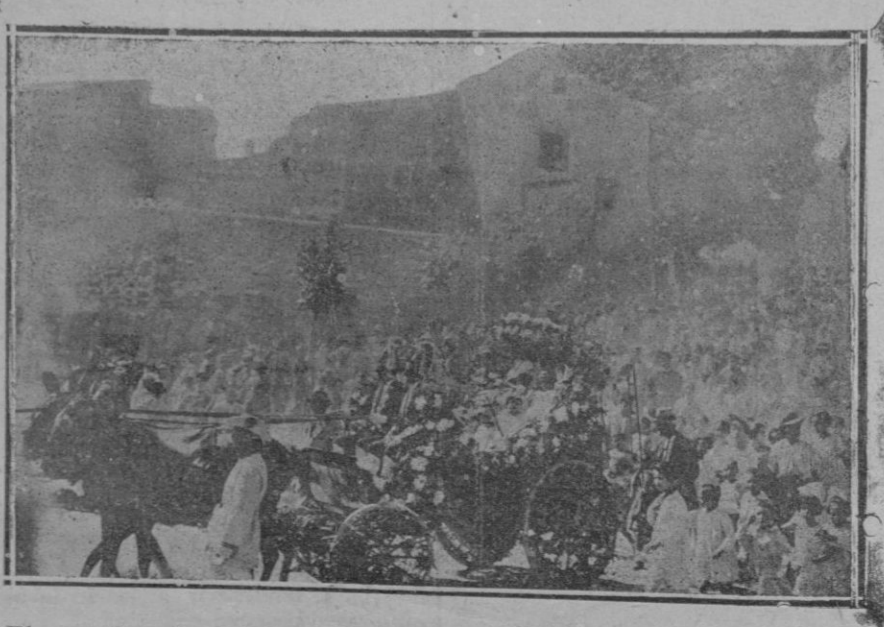
El artístico Carro de la Beata que se celebra en Valldemosa