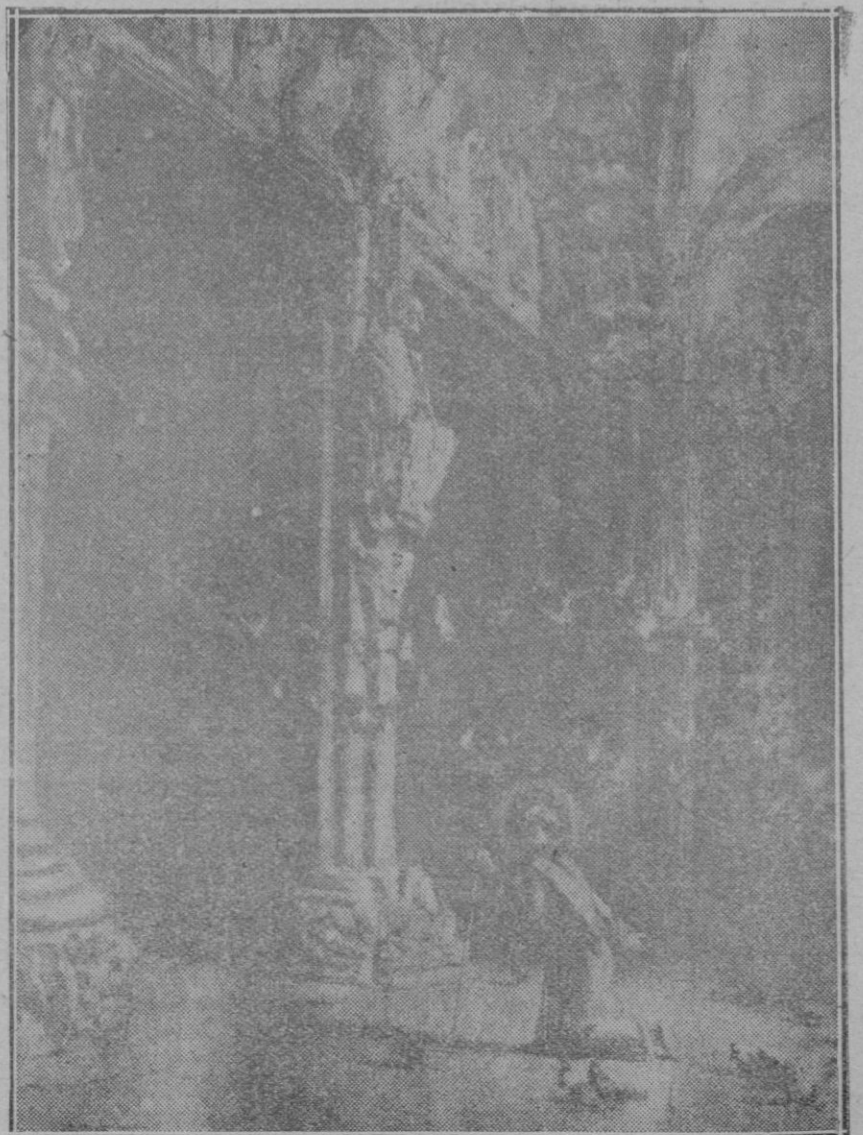
Célebre cuadro de Moreno Carbonero, de la visita de San Francisco a Santiago de Compostela