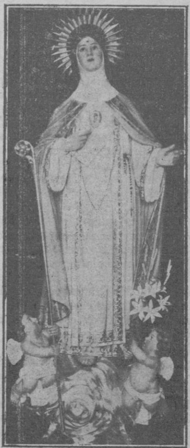
Imagen de la Beata M. Beatriz de Silva, que se venera en la iglesia de las Concepcionistas de Sineu, obra del escultor don Sebastián Alcover Garcías

fills y devots del Sant, la presenten y comprenen cumpliment. L'amor a Maria espurnetja per tot arreu en la vida de Francesc, y no podria esser d'altra manera: l'anima exquisida que se extasiava devant la bellesa de les flors y de les estrelles, ¿com no havia d'extasiar-se devant la bellesa incomparable de la Verge? El cor tot caritat y amor qui anomanava germans als aucells y als peixos, y al foc y a l'aigo ¿com no havia de sentirse enamorat de Maria, la més bondadosa de les mares?