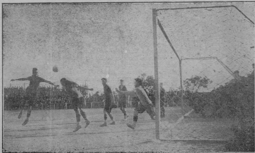
Una interesante jugada