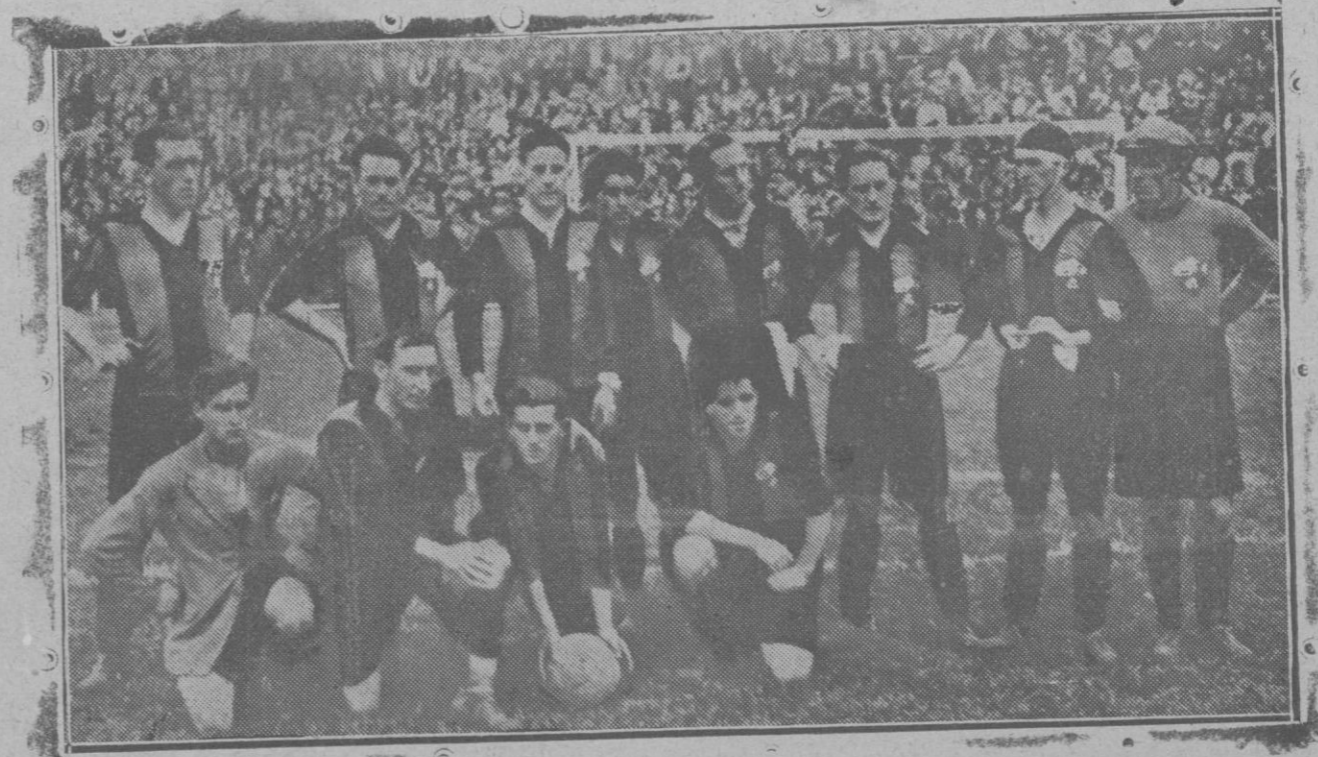
El «Arenas F. C.»

Los dos equipos que se disputan el título de campeón