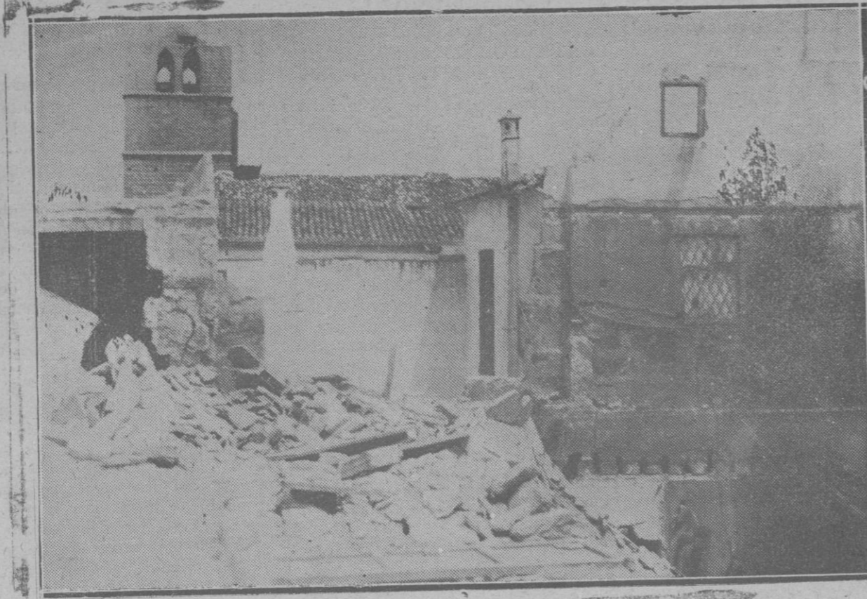
Estado en que quedaron los pisos derrumbados en la calle de San Jaime