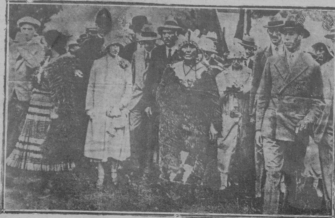
Los Duques de York, hijos de los Reyes de Inglaterra, en Nueva Zelanda, en unión de varios indios