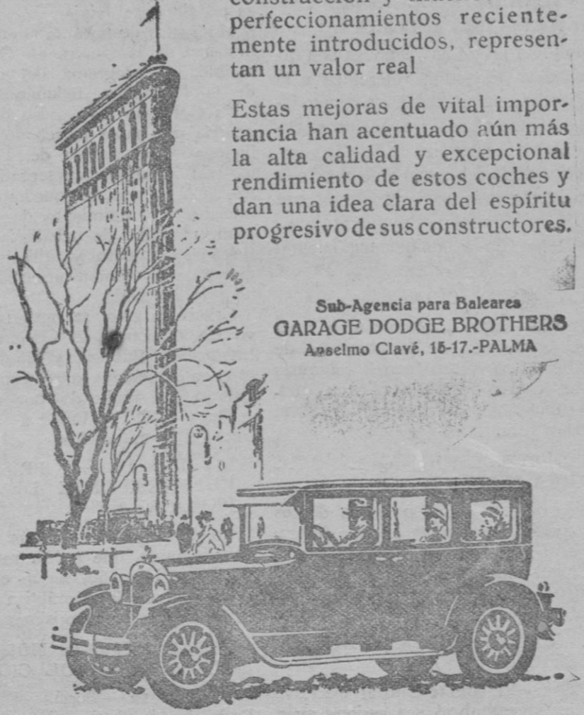
Sub-Agencia para Baleares GARAGE DODGE BROTHERS Anselmo Clavé, 18-17.-PALMA

Estas mejoras de vital importancia han acentuado aún más la alta calidad y excepcional rendimiento de estos coches y dan una idea clara del espíritu progresivo de sus constructores.