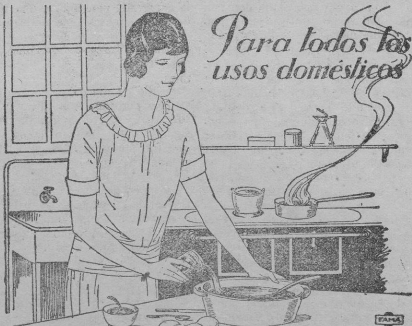
Para todos los usos domésticos

Toda ama de casa podrá improvisar cualquier receta culinaria o posire casero valiéndose de este gran auxiliar que ahuyenta todo peligro de adulteraciones e impureza. No deben faltar en toda despensa unos botes de la más pura y rica de las leches, la