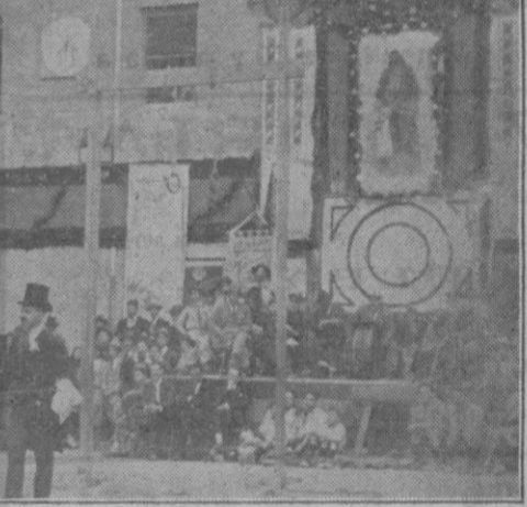
Los presos al ser conducidos a Palma