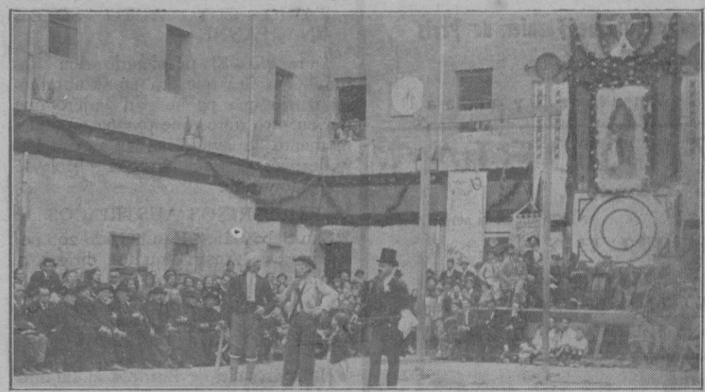
Un momento de la fiesta cómica gimnástica