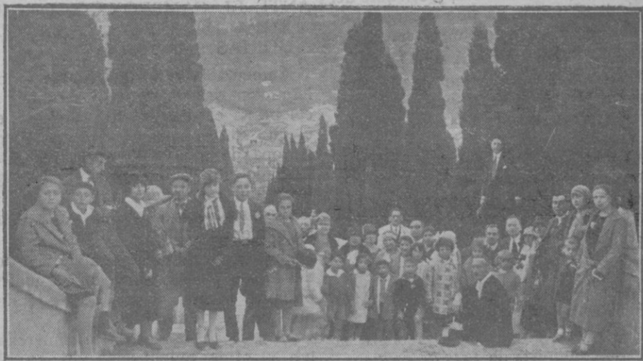
Grupo de excursionistas en el Caivario de Pollensa

encantadora. Alberto queda fascinado desde el primer momento. ¿Quién reconocería en aquella bellísima criatura a la chiquilla delgaducha, de pelo sucio y alborotado de hace quince años?